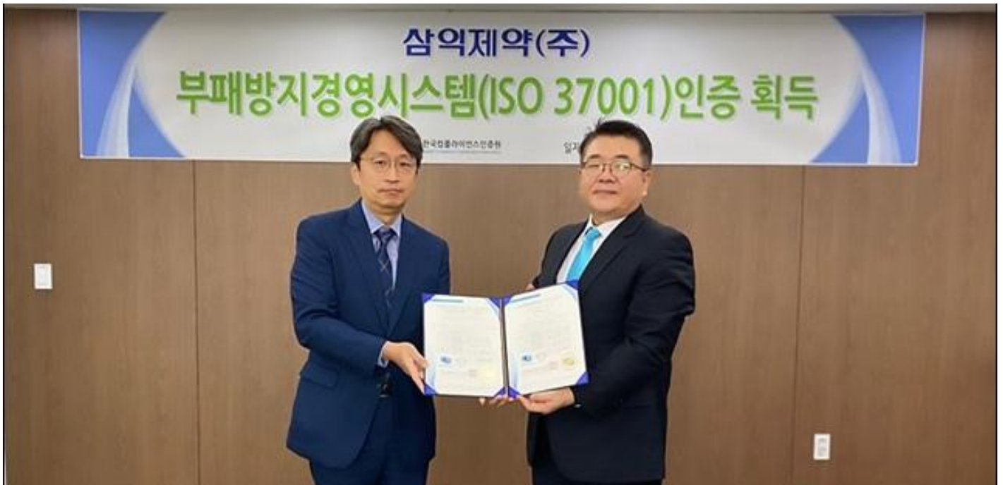
삼익제약, ISO 37001 부패방지경영시스템 인증 획득