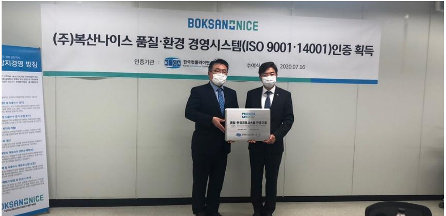
복산나이스, 품질·환경경영시스템(ISO 9001·ISO 14001) 인증 획득